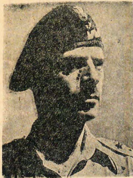
Gen. dyw. Władysław Anders dca 2. Korpusu A. P.

Wojnę polsko-bolszewicka w latach 1919-21 prze- bywa jako dowódca 1 Pułku Ułanów Wielkopolskich (15 p. uł. Poz.). Odnosi rany, uzyskuje Virtuti Militari i czterokrotnie Krzyż Walecznych. Jego pułk uzyskuje na sztandarze również Virtuti Militari.