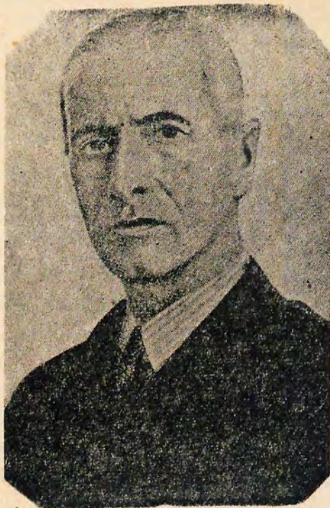
Prezydent RP. Władysław Raczkiewicz

Władysław Raczkiewicz urodził się 29 stycznia 1885 r. na Kaukazie, gdzie ojciec jego przebywał na zesłaniu za działalność niepodległościową. Od lat szkolnych uczestniczył w pracach konspiracyjnych polskich organizacji młodzieżowych. Wyższe studia rozpoczął na uniwersytecie petersburskim, został jednak aresztowany przez żandarmerię rosyjską i ukończył wydział prawny w Dorpacie, dokąd został zesłany, po zwolnieniu z więzienia. Po wybuchu wojny 1914-18 r. powołany został do armii rosyjskiej. Z chwilą rewolucji, rozpoczyna prace nad organizacją Polskich Sił Zbrojnych na Wschodzie i zostaje delegowany na powszechny zjazd wojskowy do Petersburga, na którym piastował funkcję przewodniczącego. Na zjeździe wybrany został przewodniczącym Naczelnego Komitetu Wojskowego. W czasie wojny w latach 1919-20 Władysław Raczkiewicz obejmuje kierownictwo organizacji